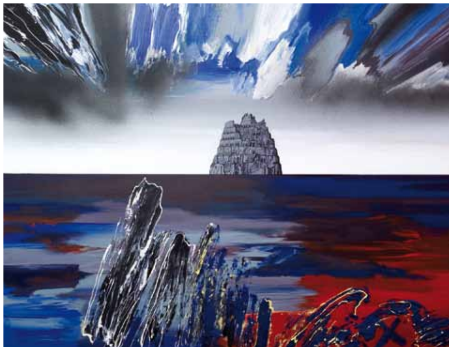
Las nubes apunta a babel. Técnica Mixta / Madera. 114 x 150 cm. 2005. (Expuesto en C.C. Anabel Segura)