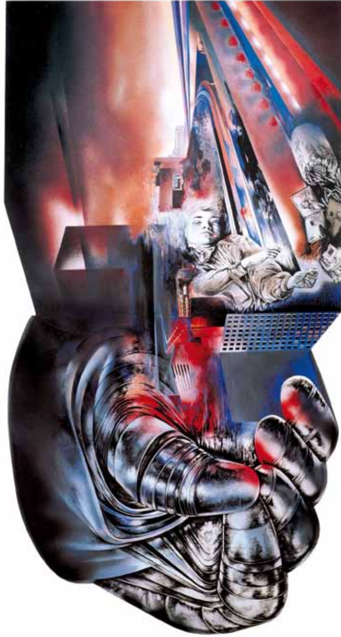
Portada: Gran paisaje y sumidero. Técnica acrílico / madera. 244 x 244 cm. 1997. (Expuesto en C.C. Pablo Iglesias) Arriba: La víctima. Técnica mixta / madera recortada. 145 x 230 cm. 1975. (Expuesto en C.C. Pablo Iglesias)