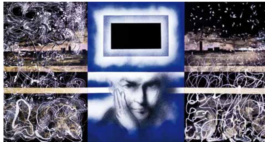
En el enigma. (Tríptico) técnica mixta / madera 122 x 243 cm. 2009. (Expuesto en C.C. Anabel Segura)

relacionado con las consecuencias sociales que su iconografía urbana nos proponía.